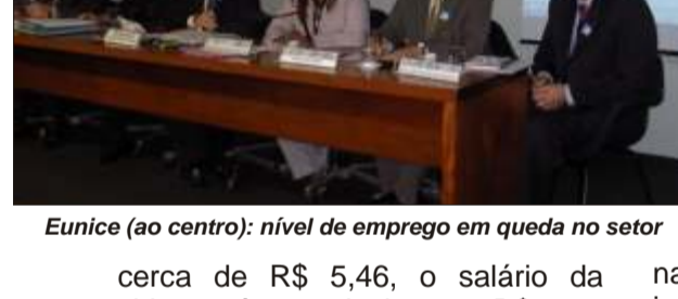
Eunice (ao centro): nível de emprego em queda no setor

Quando se compara com a indústria chinesa, nossa maior concorrente, a diferença é mais gritante. Enquanto a hora trabalhada de uma costureira brasileira custa