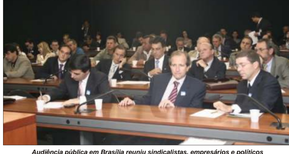
Audiência pública em Brasília reuniu sindicalistas, empresários e políticos

Na primeira metade deste ano estivemos presentes em vários eventos importantes para o fortalecimento da nossa categoria, como a Audiência Pública do setor do vestuário em Brasília e o Seminário da Juventude da Conacocvest da Região Sudeste